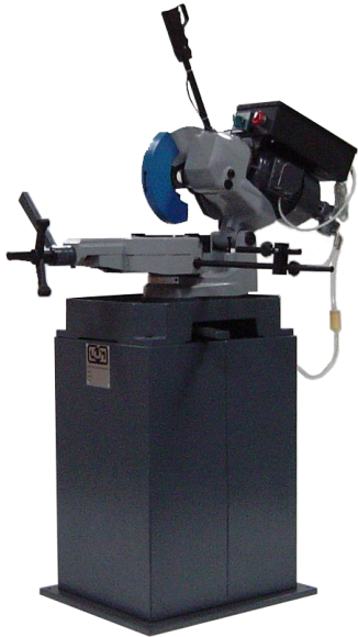
UWM 250 ind.